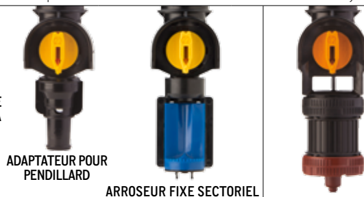
ADAPTATEUR POUR PENDILLARD

L'ARROSEUR FIXE SECTORIEL DE LA SÉRIE 3030 ET L'ADAPTATEUR POUR PENDILLARD REQUIÈRENT TOUS DEUX UN CORPS D'ARROSEUR UNIVERSEL, CE QUI N'EST PAS LE CAS DE LA SÉRIE 3000.