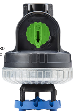
Orbitor O3030 & contrapeso