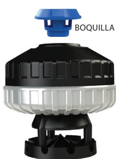
Orbitor O3000 & contrapeso